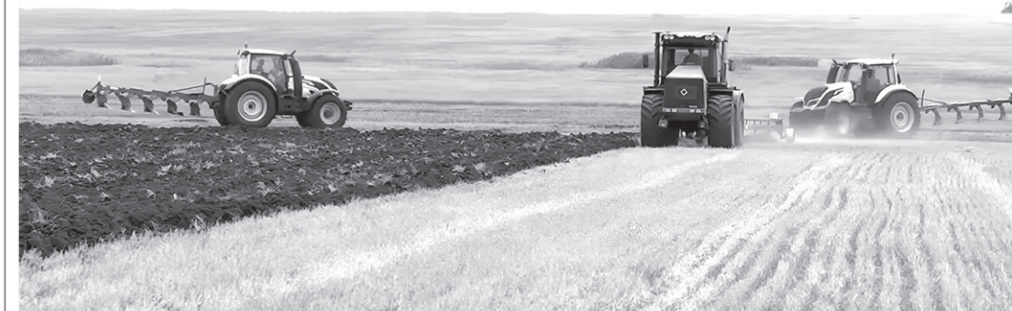
На полях Карачаево-Черкесии кипит работа

Еще больше интересных новостей на сайте denresp.ru