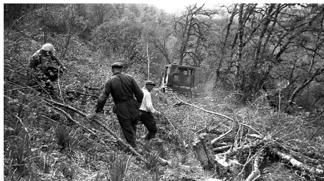
Вот так полвека назад расчищалась территория для строительства поселка астрономов

Время шло, быт постепенно налаживался, штат обсерватории расширялся, приезжали новые люди, органично вливаясь в коллектив. За прошедшие 50 лет было множество перемен, но удалось сохранить главное — теплоту и душевную, почти семей-