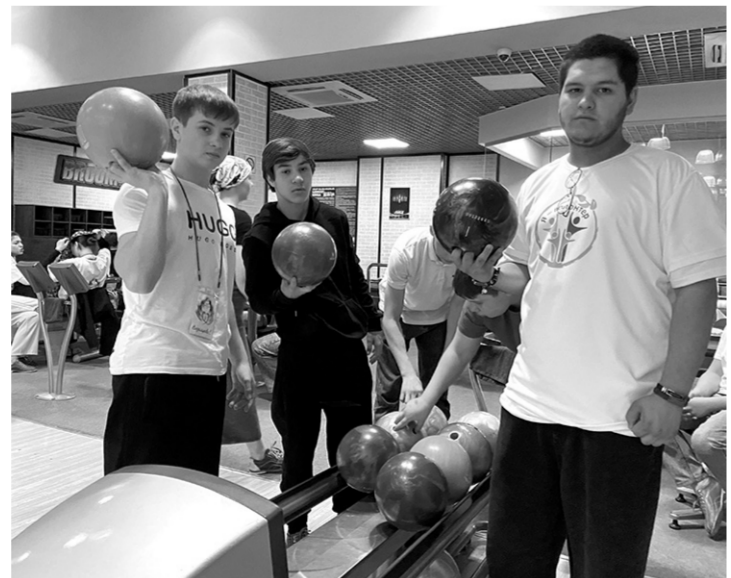
Воспитанники детского дома в боулинг-клубе

Для тех, кто прилежно учился в первой четверти, в этот день широко открыл свои двери боулинг-клуб «Brooklyn». Воспитанники детского дома были здесь впер-