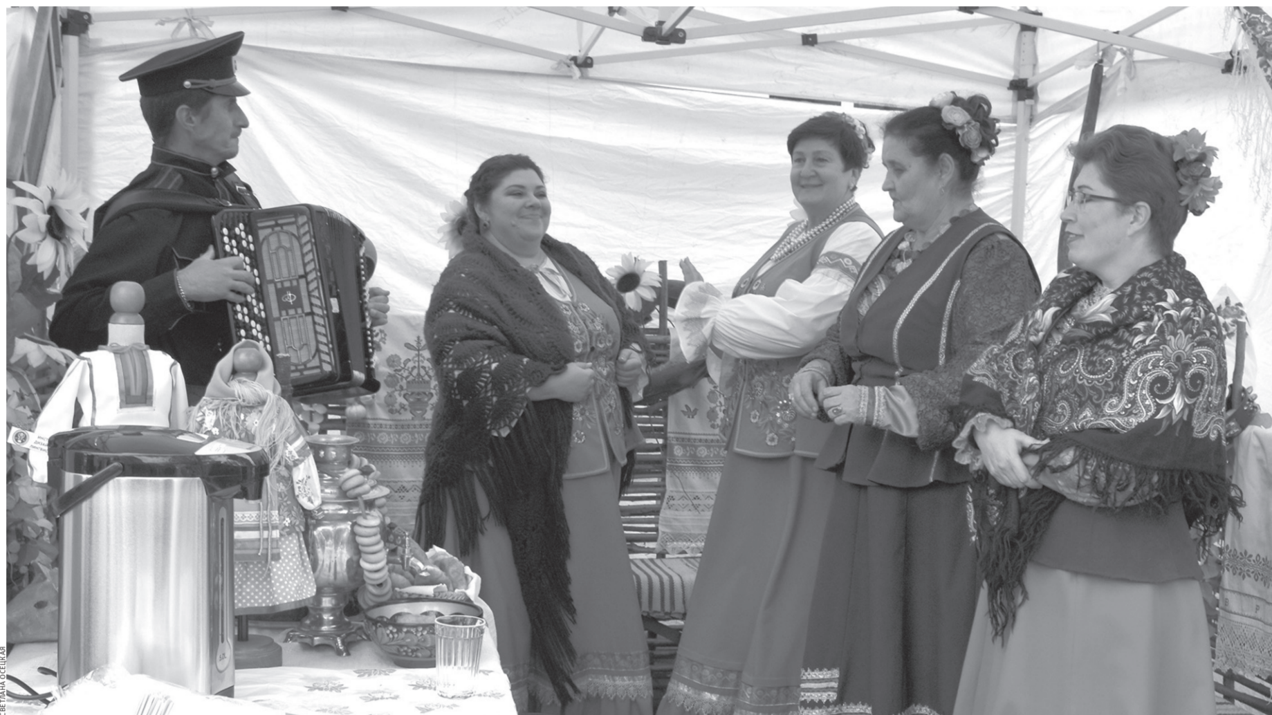
Ансамбль «Урупчанка» весь праздник радовал горожан звонкими казачьими песнями